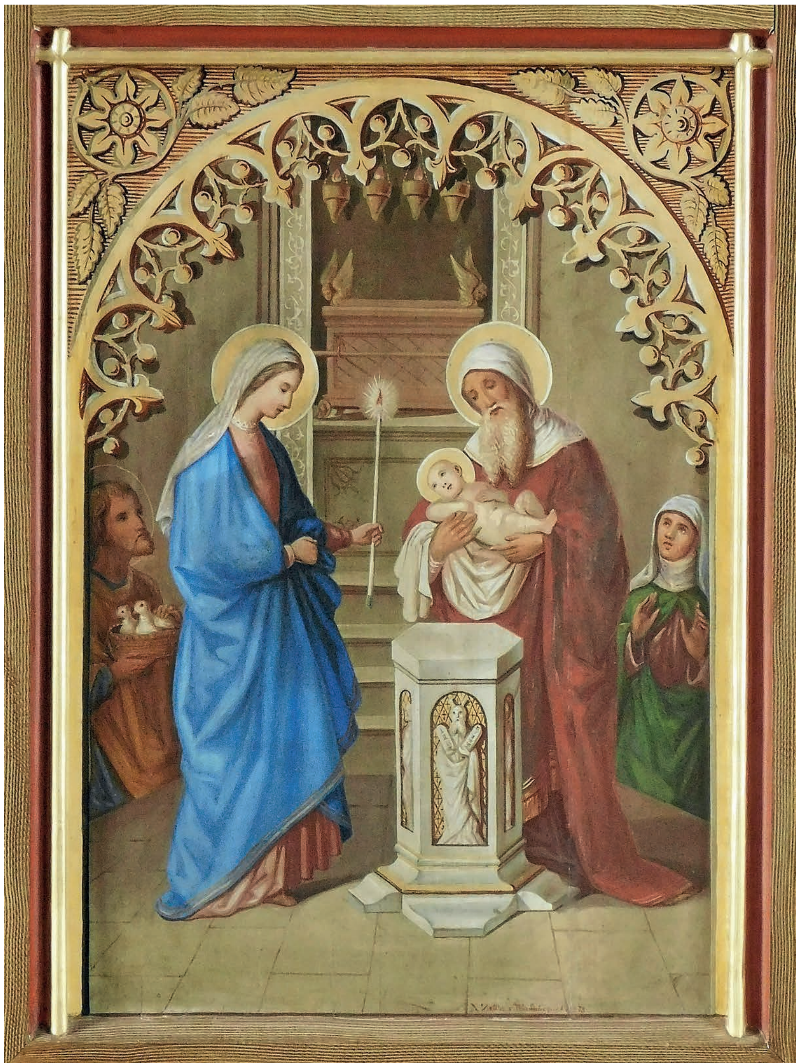
Darstellung des Herrn